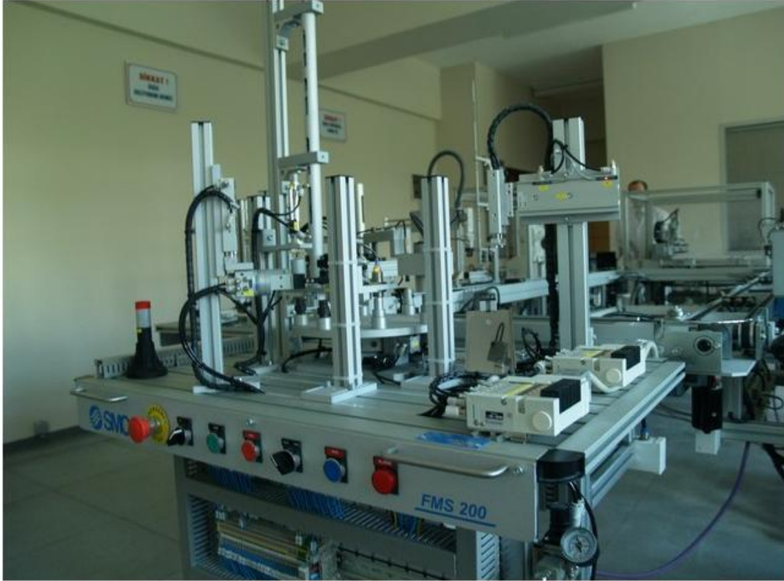
Fabrika Otomasyon Laboratuvarı FMS 200